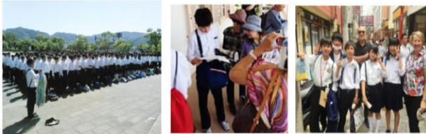
「平和記念式典」歌声とともに、本校で折った千羽鶴を奉納 特別自主研修で、歌舞伎を観る

5月22日～24日に実施した修学旅行の訪問先では、本校3年生が様々な体験学習を行いました。