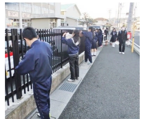
「新年を美しく迎えましょう」 生徒会とボランティアによる花植え

1月に発行されます「舞鶴の川と海を美しくする会」の原稿を頂戴いたしました。そこには、新年早々に、青葉中学校区を流れる与保呂川への願いを込めて、「ふるさとを愛し、わが母校の誇り・心の育成」を方針に掲げていただき、地域と協働した「共に学び合う環境づくり」として紹介いただき、わが母校への地域の皆様方の温かい愛情と期待を示していただきました。