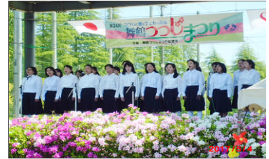
平成29年度のつつじまつりの様子

東舞鶴公園のつつじも例年より少し遅れているようですが、4月には暖かい日が続き春が一気に駆け抜けそうな勢いでした。いたる所でつつじが咲き始め、5月4日のつつじまつりには満開に咲き誇り多くの人の目を楽しませてくれることと思います。