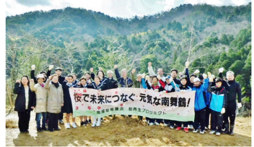
東舞鶴公園での桜植樹式

いよいよ今年度最後の月に入りました。今月22日(金)が修了式となります。1. 2年生は4日から始まる期末テストに全力で取り組み、それぞれの学年で身に付けておく学力と成績を残す最後のチャンスになります。今のこの頑張りが、1年後2年後に進路実現を果たしていくときの財産になっていきます。しっかり先を見据えて新年度に繋がる頑張りをしましょう。それが終わると13日(水)におこなわれる3年生を送る会に向けての練習が始まります。短期集中！数少ない練習にしっかり思いを込めて当日を迎えられるようにして下さい。この送る会が全校で集まる最後の機会になります。自分たちの学年としての思いを伝えると共に、自分の進路に向けて歩みだす3年生の姿と決意を十分に感じて欲しいと思います。そして、先輩たちが築いてきた青葉中学校の良き伝統をしっかり引き継いでください。