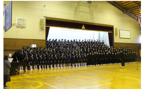
昨年度の卒業生を送る会

並行して、全校代表としての合唱団の練習も本格的に始まります。新年度のスタートに向けた入学式までの長い取組になりますが、新たな出発に向けた準備として、新年度に向けての青葉中学校の顔として、頑張ってくれることを期待しています。